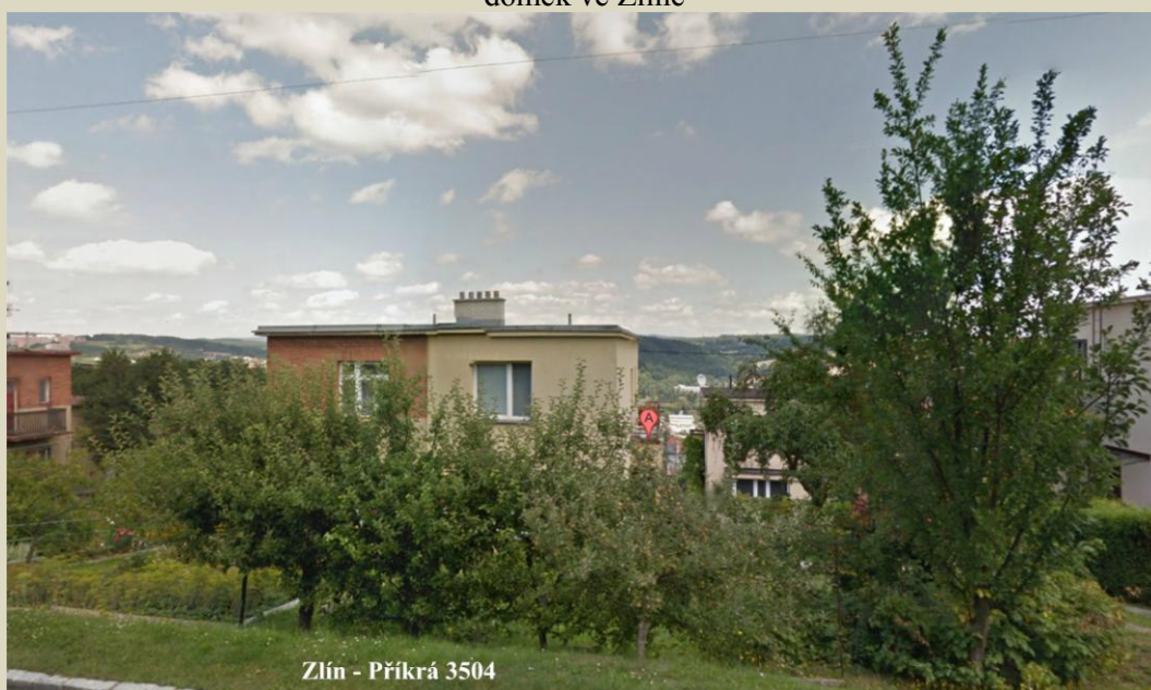
Zlín - Příkrá 3504