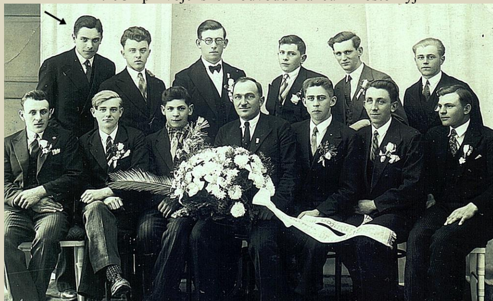
v r.1934 při vojenském odvodu branců z Hostokryj

V té době také pomáhal matce na hospodářství. Otec rodiny tragicky zahynul, když mu bylo 14 let. Byl velmi nadaný a pilný student. Přes chudé poměry pak v r. 1932 začal studovat v Praze na ČVUT - vysokou školu chemicko technologického inženýrství. Peníze na studium si sám vydělával.