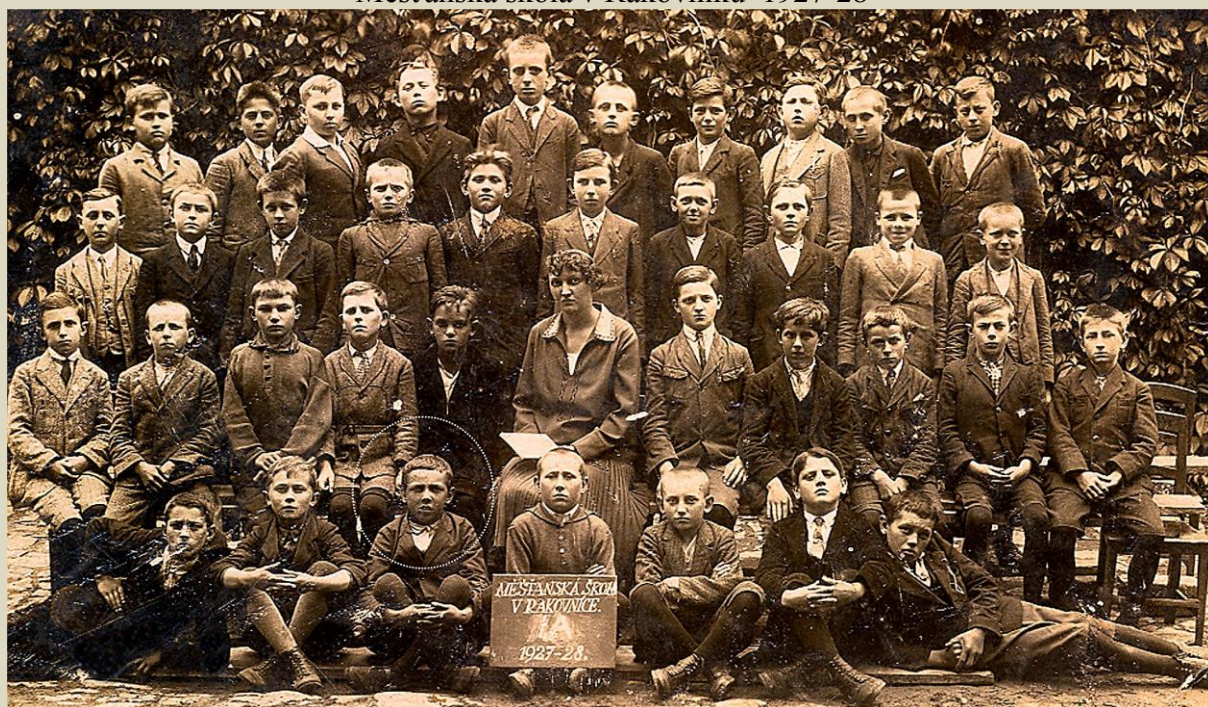
Měšťanská škola v Rakovníku 1927-28