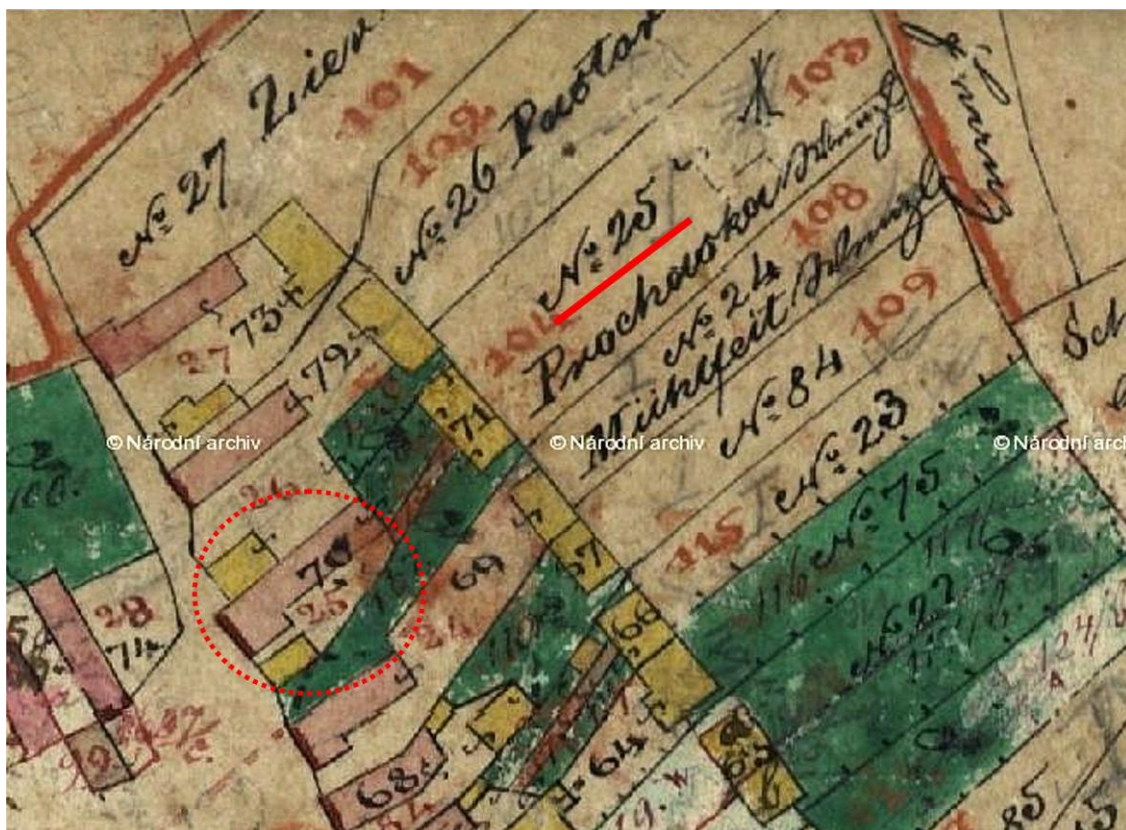
Stabilní katastr - No:25 Procházka Václav