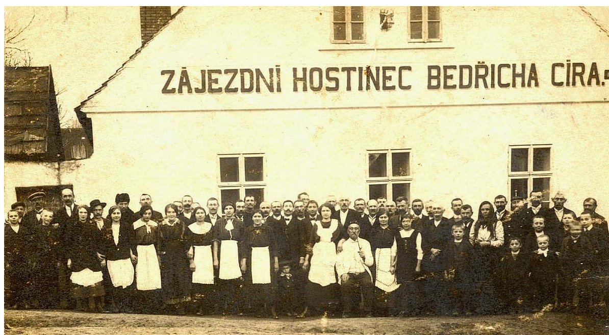
fotografie hostince čp. 18 – r. 1910