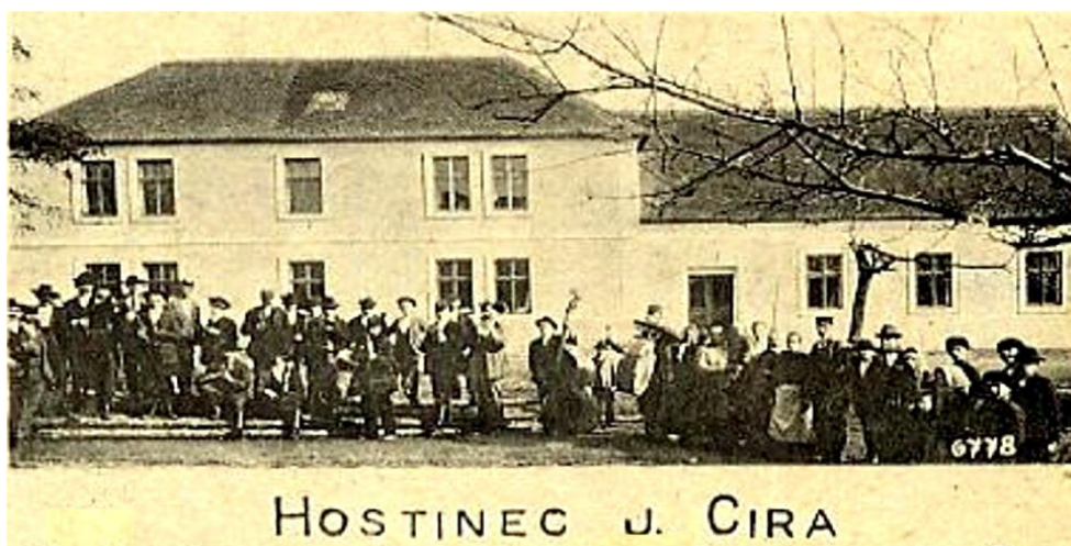
fotografie z r. 1901