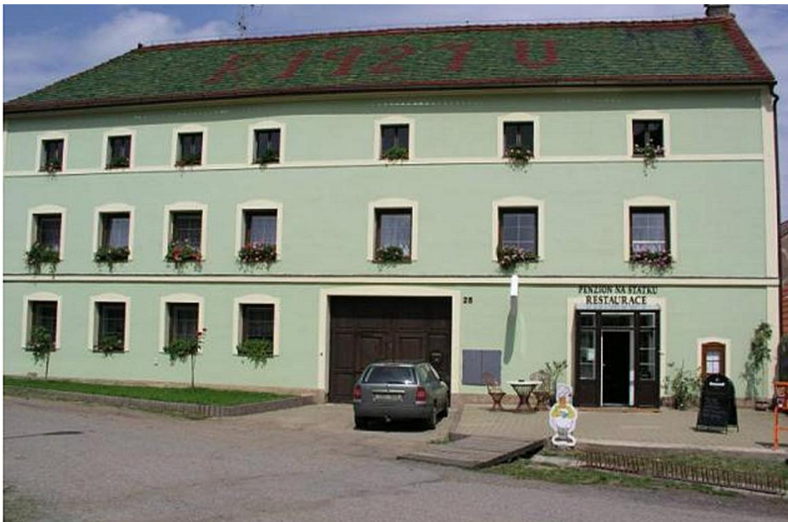
venkovní posezení restaurace Na Statku