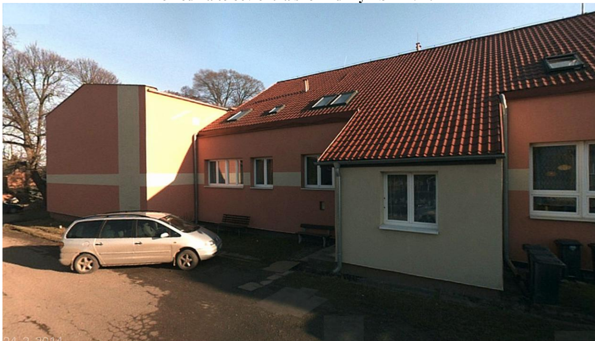
Pohled na tělocvičnu a školní dílny ZŠ - r. 2014