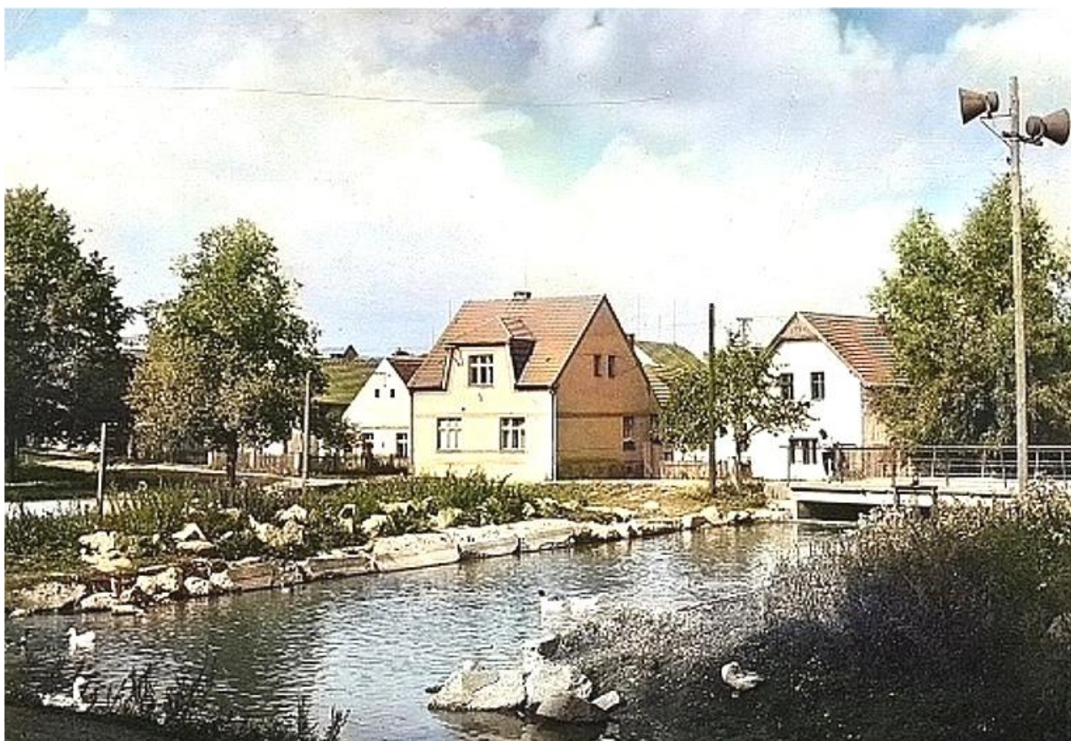
Takto vypadala návesní požární nádrž před povodní