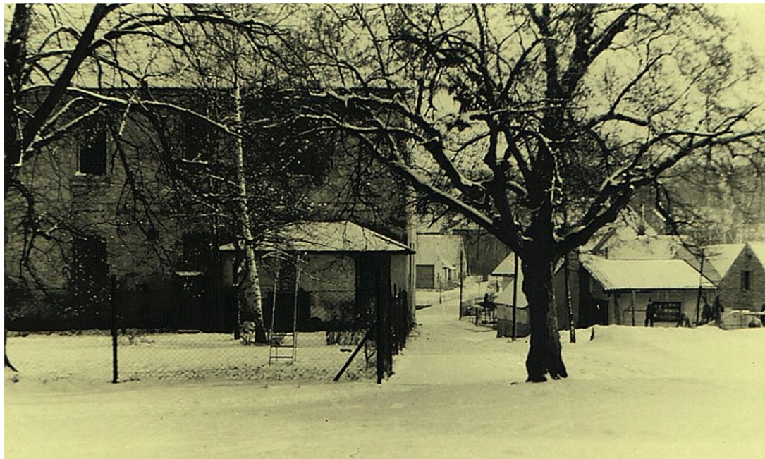
žáci mateřské školy v Šanově – r. 1957

vlevo budova mateřské školky – vpravo bylo malé hřiště pro tělesnou výchovu