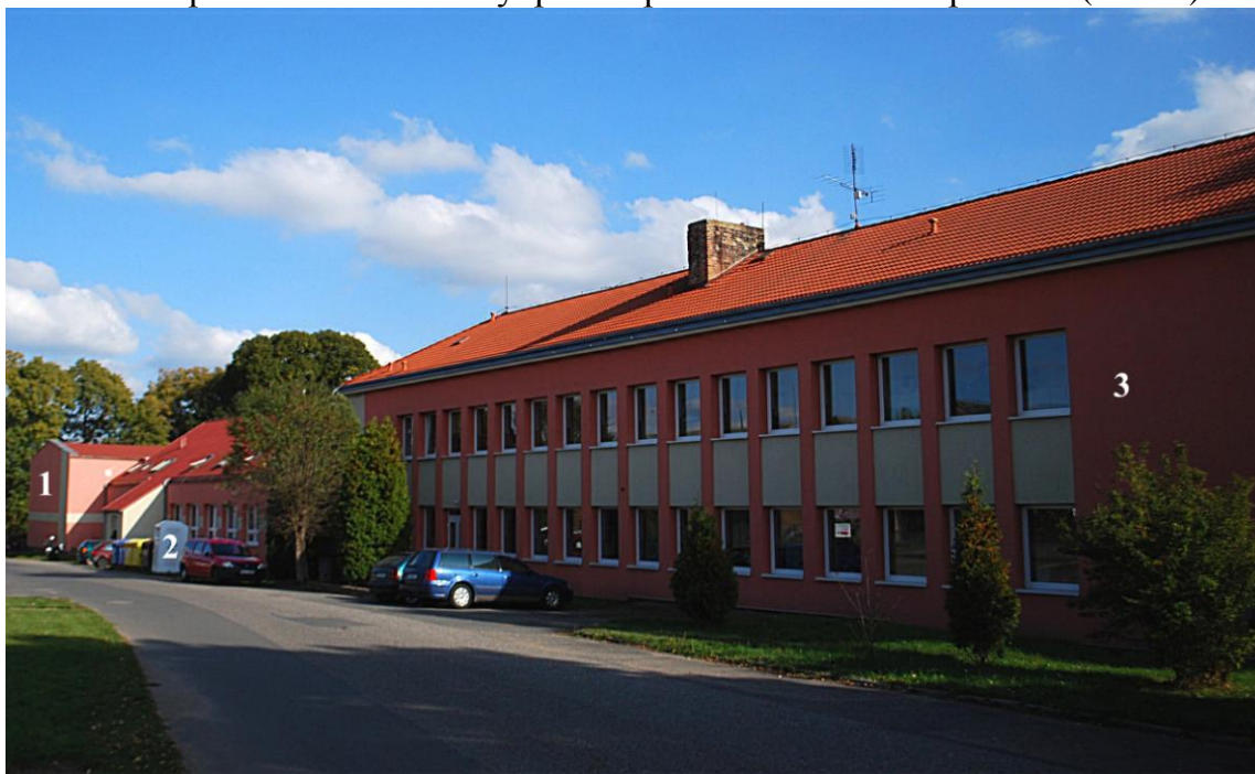
1- tělocvična, 2- školní dílny ( + byty OÚ ), 3- hlavní budova školy

severní pohled na areál školy po zateplení a stavebních úpravách ( 2014 )