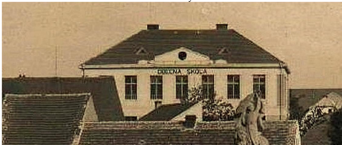
budova nové školy r. 1929