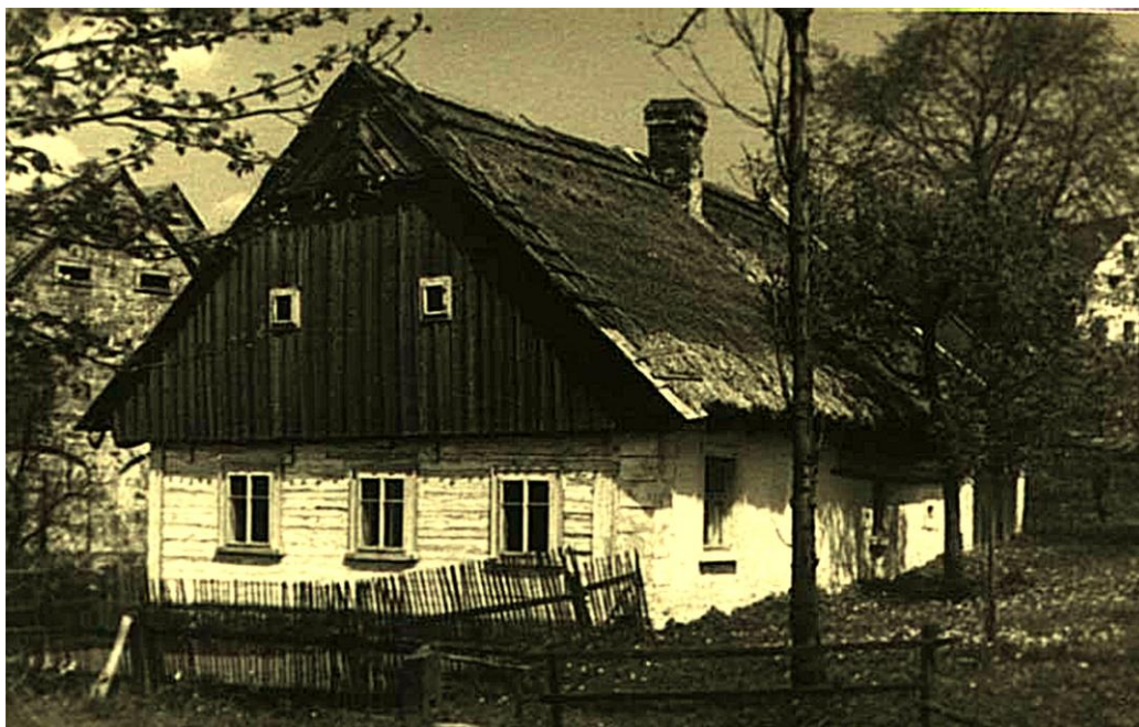
Ilustrační obrázek – budova vesnické školy z 2. pol. 18. století

V této době zde školní budova nebyla, učilo se v určených a vhodných chalupách – podle šanovské kroniky to byly např. čp. 5, čp.18, čp.35 a další.