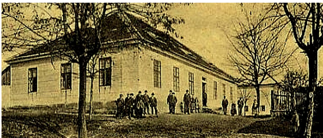
škola r. 1900

Stručný přehled vývoje školy podle archivních dokumentů