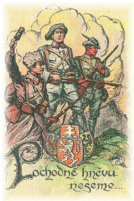
Rybáček Otakar *1889